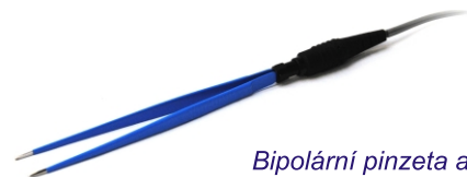
Bipolární pinzeta a kabel