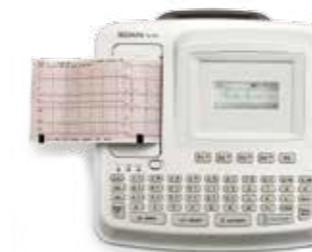
SE-601A (3.5" monochromatický LCD displej)