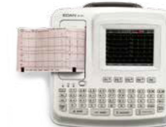
SE-601B (5.6" barevný LCD displej)