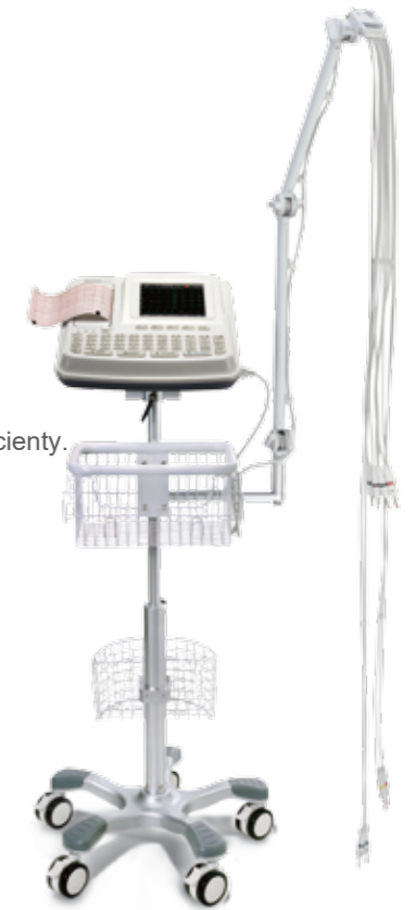
SE-601C s pojízdňm stojanem (5.6" barevný dotykový displej)