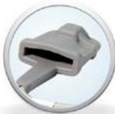
Měkká prstová sonda