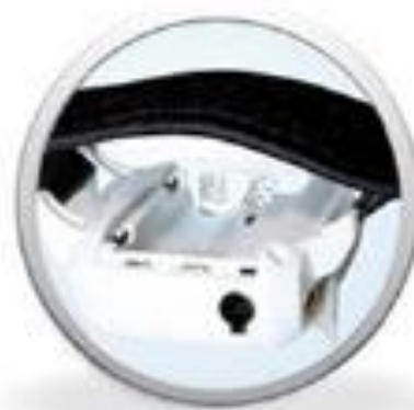
Prostor pro baterie