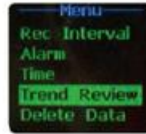
Obrazovka pro nastavení