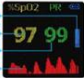
Obrazovka pro sledování hodnot